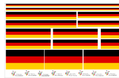
ドイツ国旗ステッカーシール (Sticker Seal German)