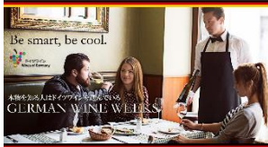
ランチョンマット (Luncheon mat)