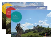
ポストカード 13生産地域 (13 Map postcard)