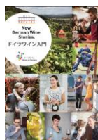
冊子：ドイツワイン入門 (A5サイズ)