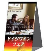
テーブルテントPOP (Table tent POP)