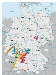
地図ポスター (Map poster)