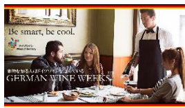
イメージポスター (Image poster)